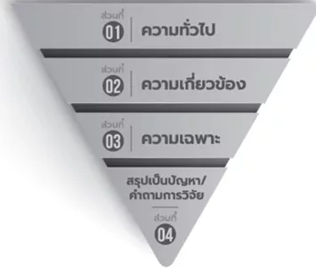
ภาพ 1 การเขียนความเป็นมาของปัญหา

หมายเหตุ : จาก ระเบียบวิธีวิจัยเชิงคุณภาพ : จากแนวคิดทฤษฎีสู่การปฏิบัติ (พิมพ์ครั้งที่ 2 น. 32), โดย ชำนาญ ปาณาวงษ์, 2563, สำนักพิมพ์มหาวิทยาลัยนเรศวร. สงวนลิขสิทธิ์ 2563 โดย สำนักพิมพ์มหาวิทยาลัยนเรศวร. ดัดแปลงโดยได้รับอนุญาต.